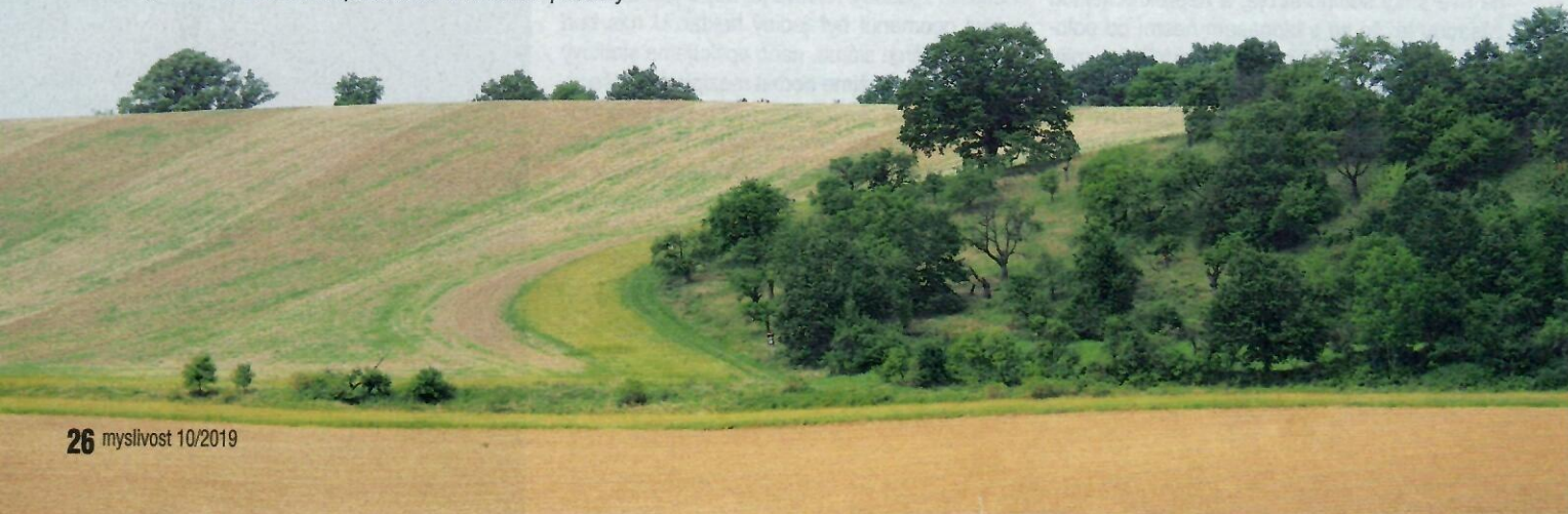
Další příklad rozčlenění krajiny, kdy biopás doplňuje zelené krajinné prvky a rozděluje dva intenzivně obhospodařované zemědělské pozemky